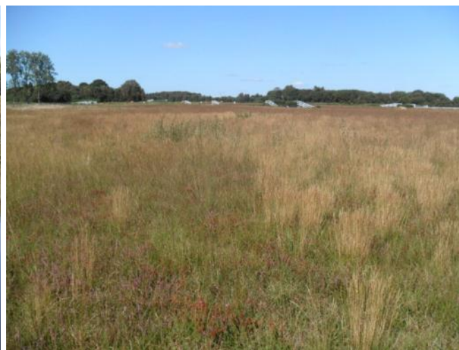
Landes humides de l'hippodrome de Quenroppers (Rostrenen)