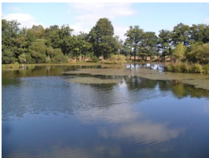
Plans d'eau situés entre le Couar et Pempoul Even (Rostrenen)

Ces groupes d'espèces y sont observés le plus souvent en passage migratoire et plus rarement en hivernage complet, excepté pour des espèces comme la Bécassine des marais.